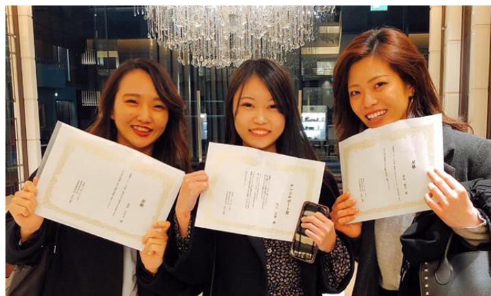
左：最年少役職者 中央・右：「グッドサポート賞」受賞者