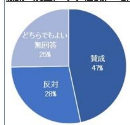
就活ルール廃止について（回答数 882 名）

採用選考の開始日を 6 月 1 日と定めた、“就活ルール”の廃止について、47%の学生が賛成と回答し、一方で反対と回答した学生は 28%、どちらでもよい・無回答が合わせて 25%と、賛否が大きく分かれる結果となりました。